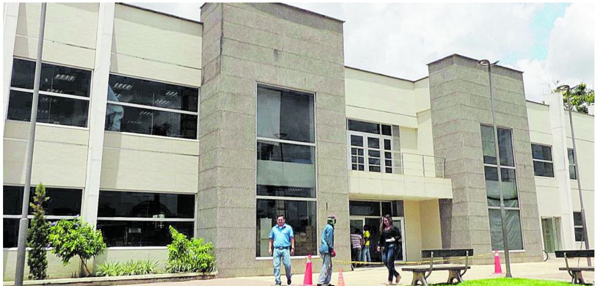
La Contraloría solicitó al equipo económico del municipio de Puerto Gaitán hacer un plan de mejora del recaudo del impuesto predial.