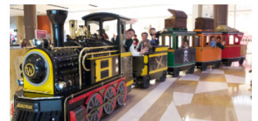
Con atracciones, Fontanar Centro Comercial busca consolidarse como un lugar de destino familiar.